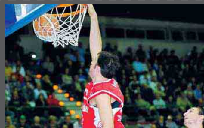
Una schiacciata di Frosini