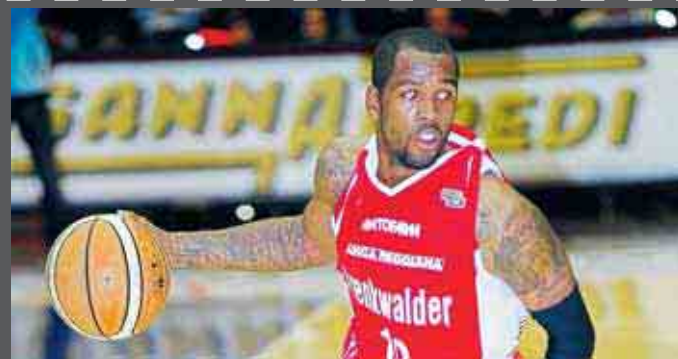
Marigney, positivo il suo ritorno